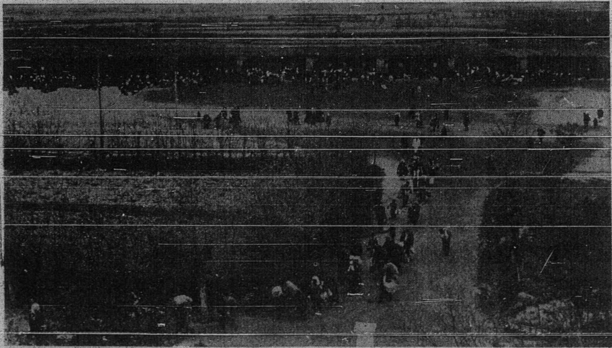
اورغ ۲ اسلام سدهغ دسبوه اوله اورغ ۲ تركي داديرني ستله كبلوا. ز. دري سمدان بلغاريا - كمبر ۲ يوسين.