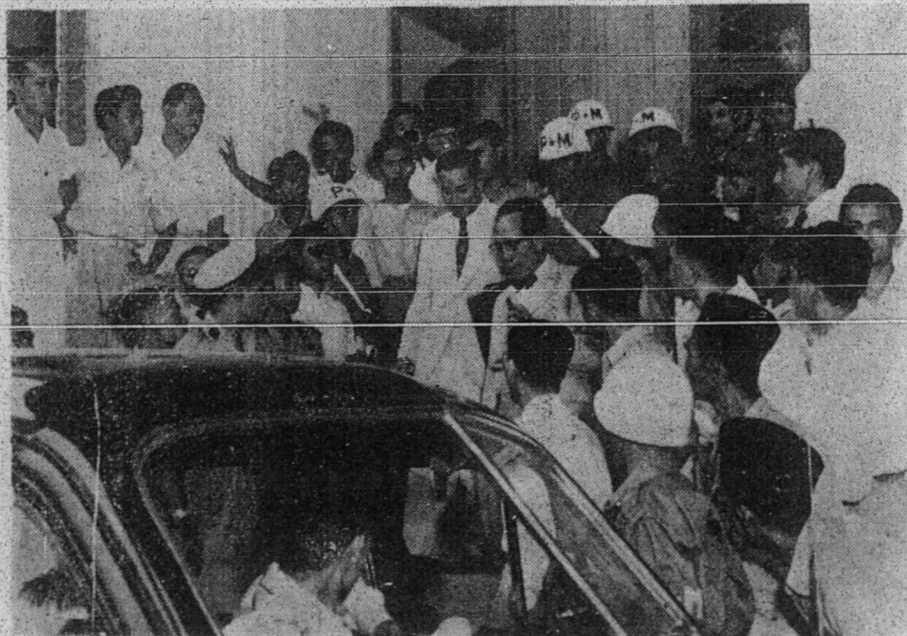
سلطان عبدالحمید یقتله منریما حکومن 10 تاهون فنجارا کران بر شهه دغن ویسترلیغ سدغ کدوار دري محکمه . - کمبر ایفوس .

دغن کادان یغ سدمین این بولیهاکه نکارا اکن سلامه؟ هان منوره کفرچیان سفردین فرویرا نکارا دغن اسلام منجافی ککوانان ایتوله سهاج نکارا اندونسیا اکن دافه دسلامتن دالماس یغ اکن داتغ دان سب ایتوله تیغ ۲ اومه اسلام دسرو اولیهن سفای بکرج ددالم فمیلین عموم یغ اکن داتغ باکی مننتوکن چورق اسلام داندونسیا میگوکوة سمستین .