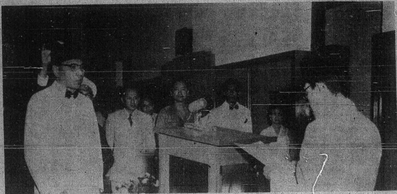
لینتو دا یغ فاسیوغ، کینور سولاولسی یغ بهارو تله دلنتیق دغن رسمین دجا کرتا دغن دخالصری اوله منتری دالم نکری فروفیسر خلدیرین دان بکس کینور سولاولسی سودیرو. - کمیر ایفوس.