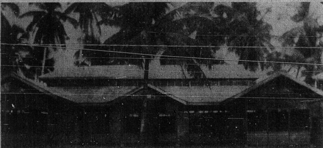
مدرسه شمس المعارف الوطنية، تنجوغ فياندغ بههارو سيف دينا دغن فر بلنجان $20,000 مدهمداهن اكن بايق لاكي سكوله ۲ رعية يفترديري دان تروس برخدمه مغمسكن علم فتهوان اسلام .

سكنله كماجوان اسلام دتانه بسر ابروفه يفتله دتوليس اوله سئورغ بغسا اسبع يغ سفهاج دفتورنكن دسين ، مسكيفون اد براتوس ۲ اهل نوار يخ اسلام سنديري يفتله مبنفكن حال ايت دغن لبه لواس لاكي . سغكوهن نادافه دسكل بهوا اسلامله يفتله مباوا سكل كماجوان دان يفتله منديريكن سكوله ۲ تيغكي سرت بمبوك كدوغ ۲ فتهوان دسان يغ كرآن بنوا ابروفه تله منجادي ترغ بدرغ دغن "نور" علم فتهوان اسلام سنله مقالهي ككلافن دان كجاهلين برقرون ۳ لمان .