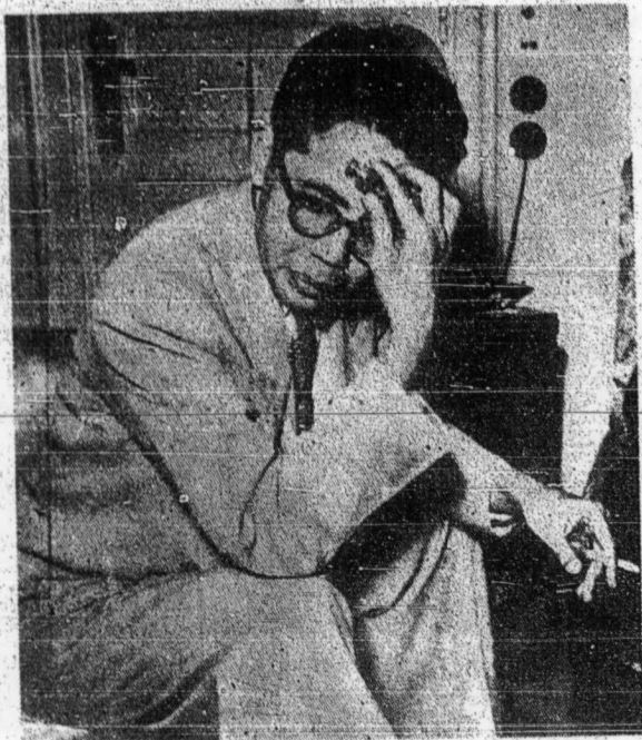
محمد ناصر بکس فردان منتری اندونسیا دان فمقین فارتی مشومی فد هاری این