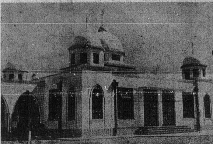
مسجد یغ انده این ایاله مسجد بندر "سریا" برونی، یقتله ددریکن اوله شریکه مییق سبکي فرسمباهن کفد سلطان برونی.

بتول، عالم علماء اد اختلاف تنغ یغ مان له افضل، سمهییغ دفادغ اتو دمسجد امام مالک مغانن سمهییغ دفادغ له افضل کران برفندو کفد فربواتن نبی یغ سننیاس مخرچاکن سمهییغ عید دفادغ، منکل امام شافعی دانلایتن، مغانن له افضل سمهییغ دمسجد، کران ای ممدغ حکمتن ایاله برکتوغ کفد لواس دان سمقین سبواه مسجد، کالو مسجد سبواه