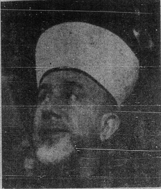
مفتی سر المسلمین الحاج محمد امین الحسینی

اداله دایهکن بهواسروان کیت کفد "علماء یغ برکلا یکن " سفای بر اجتهاد ایت بوکنله دغن تجوان سفای مریک مفعلاکن یغ حرام دان مفجرامکن یغ حلال درفد حکوم ۲ اسلام یغ دمقصودکن ایاله لایان فراوداغن یغ چوکف دان سوسای ترهادف کادان ۲ بهارو. حاصل تفصیلات حکوم تیدقله منجادی سوال لاکي سبب جامینن مصلحه مشارکه منوره کارینن یغ بر اداله تردافه دالم فرجلانن اجتهاد مریکیت سفرت یغنه کیت یکن دهولودری این. کیکوان فراوداغن مستیله دفجهکن. حال ایت تربات فتیغ دان حاجه چفتن بیلا کیت رنوغکن کفد فرایدارن اومه اسلام منوجو اکام مریک هاری این. کراجان فاکستان یغ هندق دبتوق فرلمبکانن سچارا اسلام ایت اداله لافغن یغ سو بر انتوق اجتهاد علماء ۲ ایت.