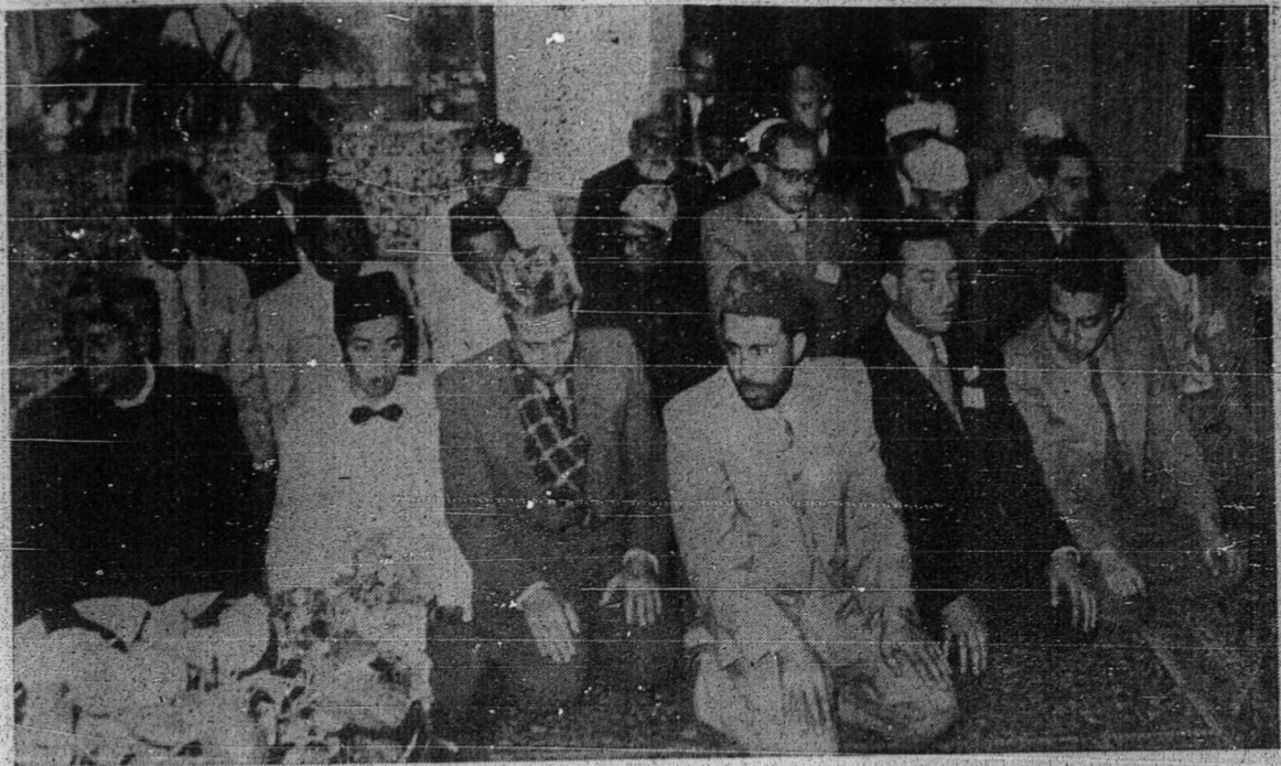
سپهائين درفد و کيل ۲ ددالم فرسيداغن فمودا اسلام مدنيسدغ سمبهيغ افيل تياوقت سمبهيغ.