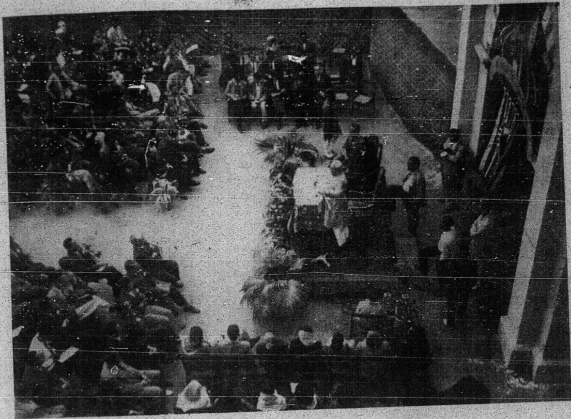
فنداغن دمجلس فرسيداغن مومتمر فمودا ۲۱ اسلام سدنيا

"امنو - عيم سي ايه - كونيشتين" ايت منكل دلان فيهق تيمبول فول اوسهار قسقا اوله فارا بيجق فندي فارا فمبسر تر كدل دغن "ناشيونل كونفرينس" ايت - افكه بايك كدوا ۲۱ اين، اتو يبع مانكه باگوس اتوق دايكوة ايت بوكن منجادي مسالة دري اف يبع ساي فرچاكفن سكارغ. (سرهكن اين كفا اهل فوليتيك) .