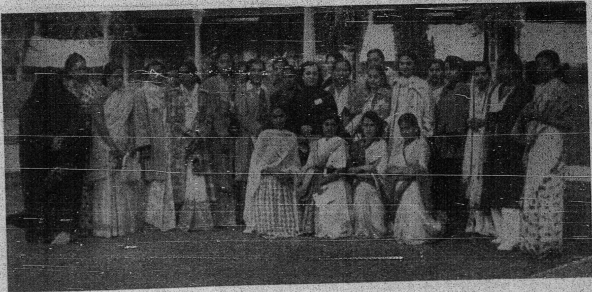
وانيتا ۲ اسلام يقتله ممتحاضري موتمر فمودا اسلام دكاراچي

دالم بولن جنواري يغلالو، "موتمر فمودا اسلام سدنيا" (موتمر شباب العالم الاسلامي) يقتله برسيدغ دكاراچي تله درسميكن سباكي سبواه فرتوبهن يغبر فرلمبگان، يغبر تيجوان مغاليركن اوسها ۲ فمباغونن دان فرقادوان اومه اسلام . سموا اورغ اسلام - للاكي دان فرمفوان - يغ برعمور انتارا 16 ههك 40 تاهون برحق منجادي اهلين . بهاس رسمي فرتوبهن اين ايله عرب دان اغكريس دان ايبو فجايتن برتمفة دكاراچي .