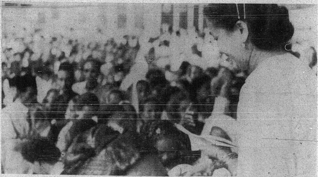
کمبر منجوقکن چیء حلیمهتون چالون فرایکاتن سدغ منر یما تهئشه ۲۰