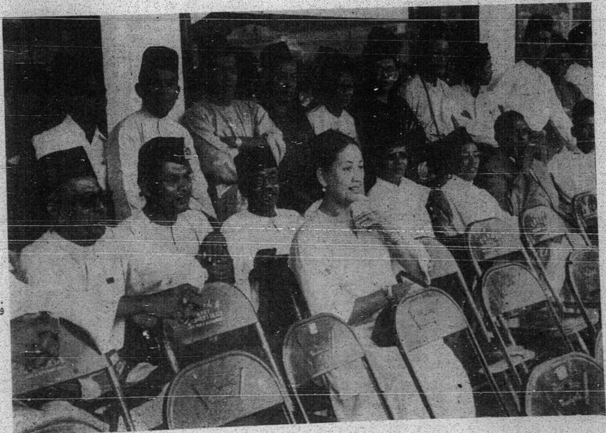
دالم کمبر ۲ بقر دليه وجه ۲ دري فممين ۲ برجاي دالم برجاي قول فجايتن يعق بهار