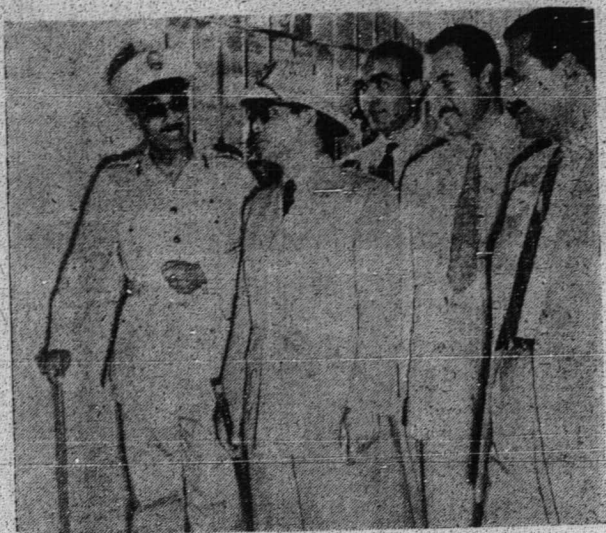
فريسيته سوکړنو مدغ برسيار ۲ دمضر مليه "الاهرام" حاصل فنيگالان فرعون

53. کالي يځ کدوا دجالن ترليه فمندا صدقه يځ هابيس اوفاي توبهن منځکوڅ فباکيه يځ دهشته اورغن سمرت بهکي برپاوا