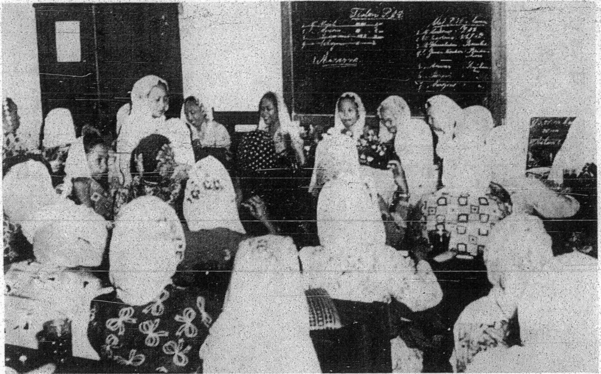
فتماواتی دکلیلیغی اولہ ورک عائشہ.

عائشہ جاگرتا (محمدیہ بہائیین فتری) تلہ مغادکن سمبوتن کنفستغہ ابد بر جواغ. دشن دخاضری اولہ فتماواتی سوکرنو