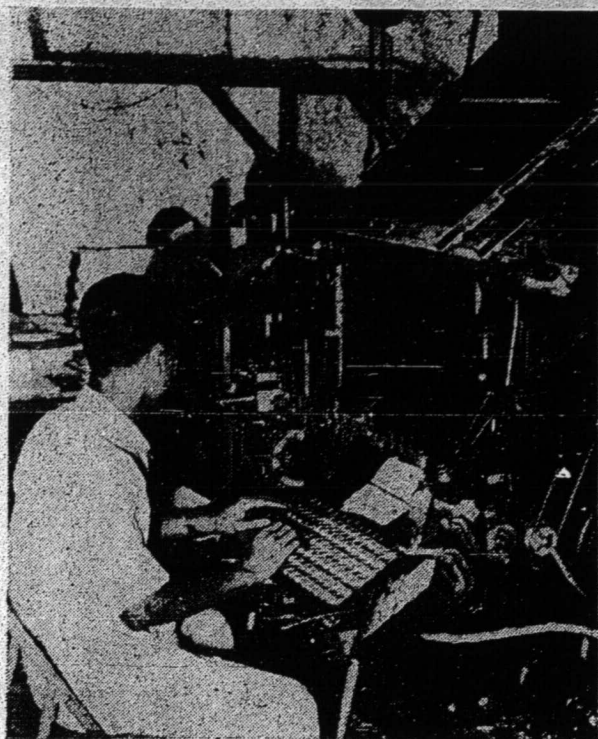
اینترتایف بهارویغ دجالنکن اوله ا. عدنان

الحمد لله قلم یغ ددیریکن فد بولن فیرواری 1948 دغن فرمولان بوکوژ سیل فلسطين دان مولای فرچیتکنن فد بولن سقتمبر 1950 هاری این تله چوب مغادکن فرسیافن ۲ اتوق معهادفی فرکبیاغن ۲ یغ باکل تربیه درفدادان بهاس ملایو دغن تولیسن رومی سباکی بهاس دان تولیسن رسمی دفرسکتوان تانهملایو. بولهله دکتاکن بهوا فد ماس این قلم دغن فرچیتکنن منجادی ساتو فراوسهان یغ بوله بندیتکن دغن فراوسهان ۲ اسیغ تننغ کبرسیهن فرچیتکنن دان الت ۲ اتوق معهادفی فرکبیاغن ۲ ایت. فرچیتکنن قلم یغ دمولای دغن سبواه میشین چیق کچیل دغن میشین فموتق قرطس یغ کچیل فد بولن سقتمبر 37 سسموغنن فد موک