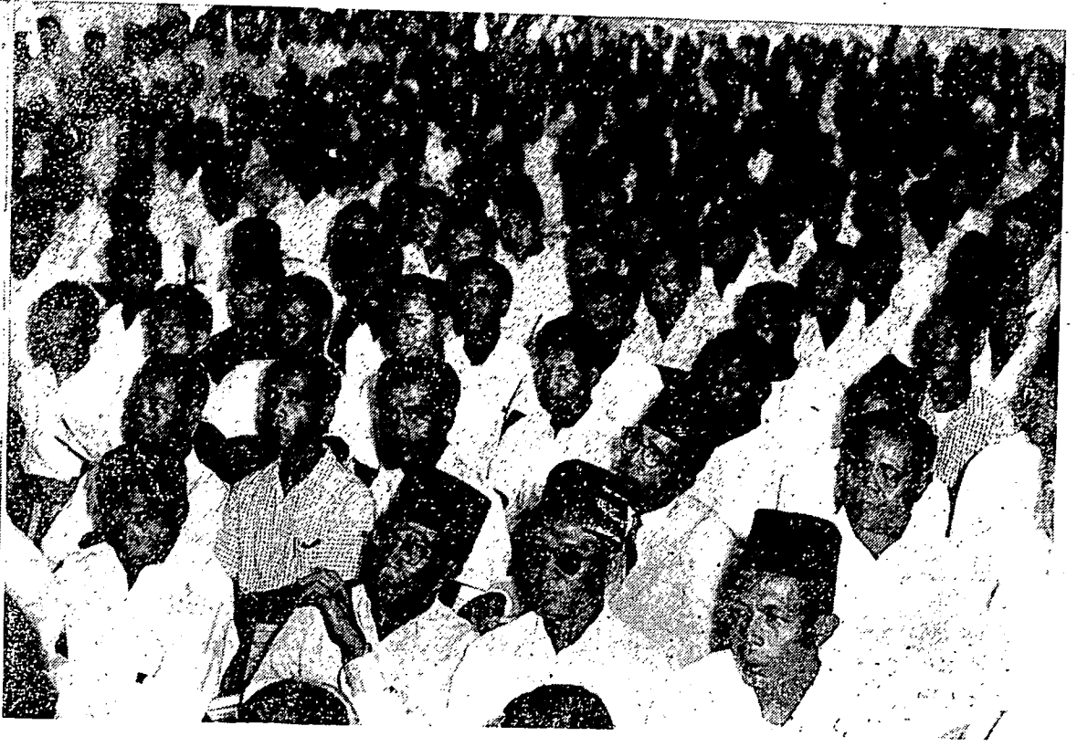
سہاگین حاضرین دالم رافہ عموم فارتي رعية سيغافورا.