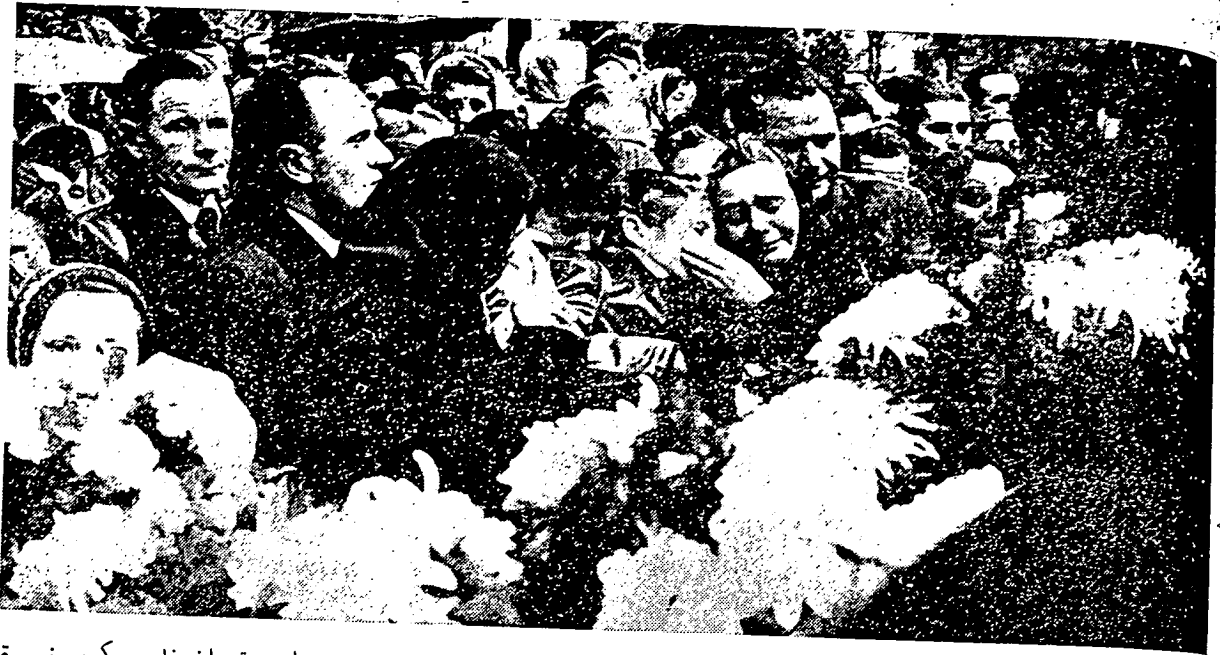
رعية هنگاري - لاکي فرمفوان - سدغ مراتف کران سودارا مارا مريک يفتله منجادي قربان فلورو کوميونيسه.