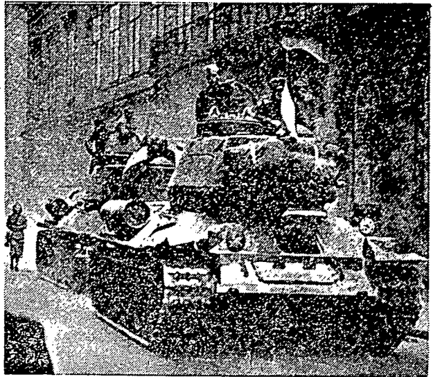
تنترا هنگاری تله ائگن منوره فرنته کتوا ۲ مریک دری قوم کومیونیسۂ باگی مہونہ بفسا مریک سندیری بهکن تنترا هنگاری دان کریتا کیلن این تله برفالیغ تاده لالو مپوکغ رعیه دان مبدیل کومیونیسۂ.

رعیۂ هنگاری تله مندسق فرنته هنگاری یغ دمنین اوله امری ناج سفای دادکن فیلیهن رای بیسن سبراف سکران دان منتتوه ففوندوران تنترا سویه بومی هنگاری تنافی فرمنتان رعیه این تله دجواب کومیونیسۂ. دغن فلورو مریم دان کریتا ۲ کیل باگی ملان رعیه یغ چنتاکن کیببسن.