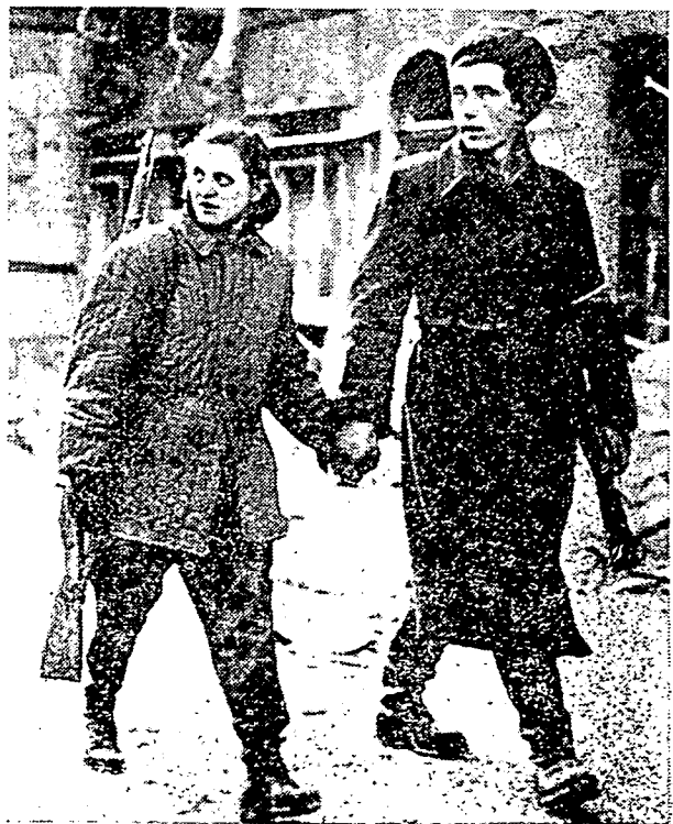
رعیه هنگاری - لاکي دان فرمفوان - مفشکة سنجان دان مھیلا تانہا یرن دری ککجامن کومیونیسۂ.