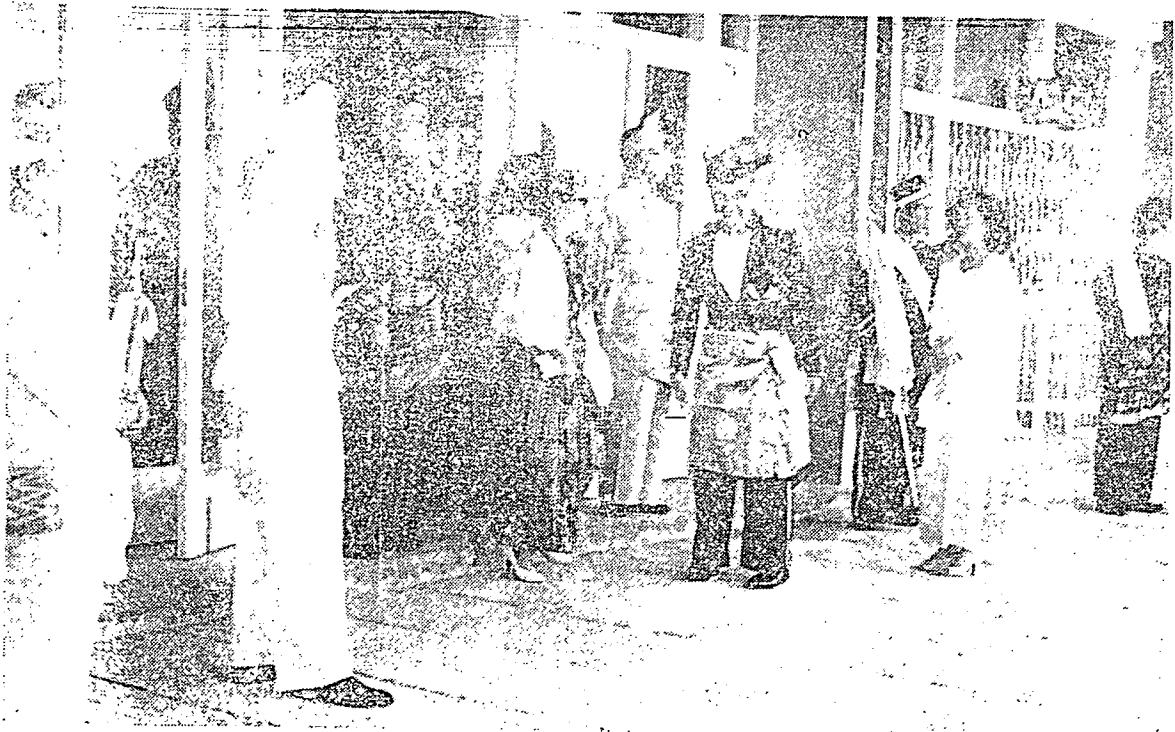
دولي ۲، يشهما مليا راج ۲، ملايو سدڻ منوڻگو سمنين اشڪاتن سري فدوڪ يڏفرتوان اڪوڻغ فد هاري بگندا دٻلڪن.