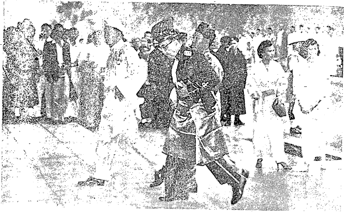
يشهما مليا سلطان سلاڻور سدڻ منوجو استان نڪارا. دڪيري بگندا ڪاينهن پيڻ حرمة داتوء عبدالرزاق مئٽري فرتهانن.