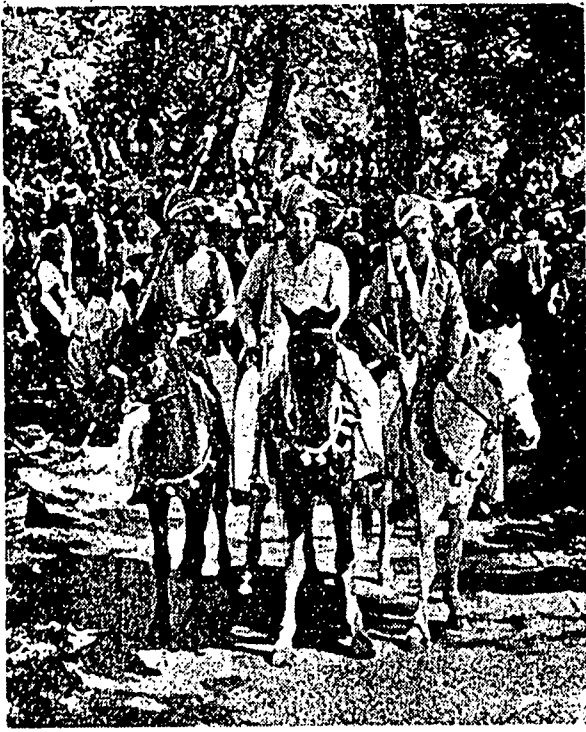
تيك اورغ اسلام يفرجيو فهاون، دري سوکو «باجاو» دبورنيو اوتارا، سدغ منوعغ کودا دالم سوات فرايان کبفسان.