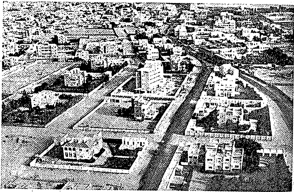
سوات فمنداغن دبندر جده. بندر فلاپوهن این منجادی تومفوان اورغ ۲ حاج فد تیف ۲ تاهون.

اومه اسلام تله باغون هاری این ستله سکن لام دتیندس اوله فنجاچه دغن کجم. نکارا ۲ اسلام یغ تله برجای مجهکن بلتکو فنجاچه ماکن برتسمه بیلاغن دمرات ۲ دنیا. تیف ۲ ساتون سدغ بکرج