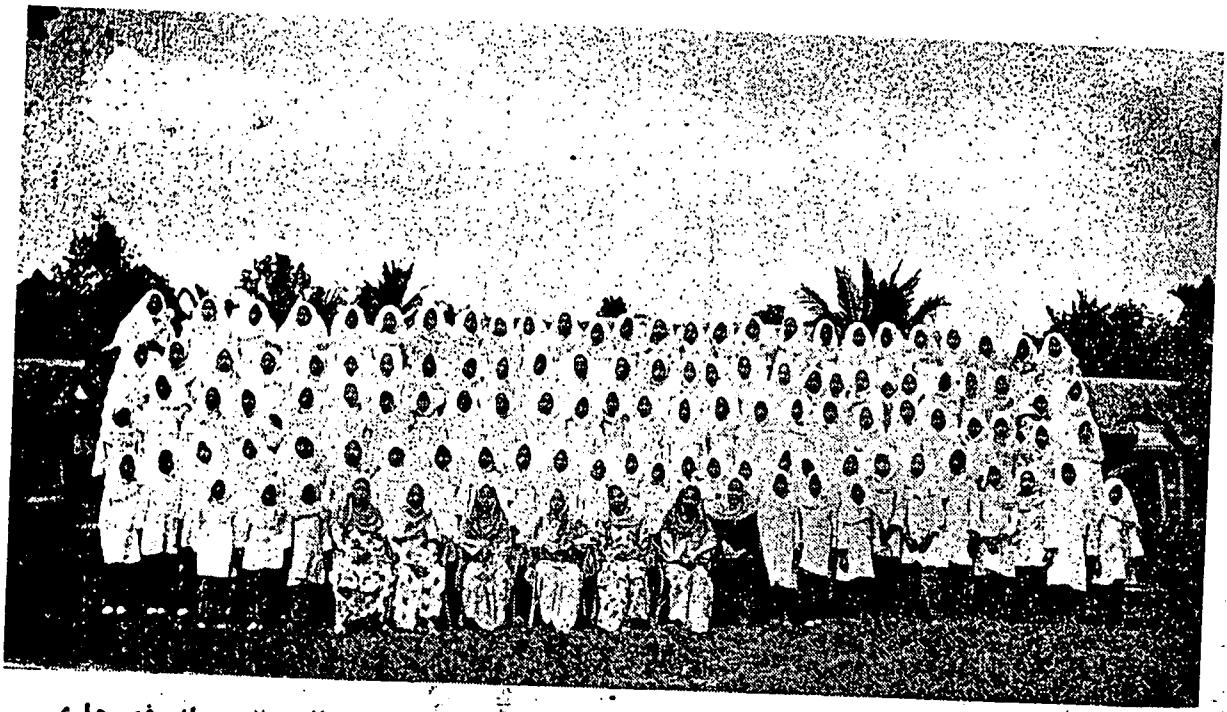
فئننوة ۲ فرمقوان مدرسه الوطنيه كوءدياغ، قدح، بر كمبر رامي دغن كورو ۲ مريك فد هاري فريساهن انتوق برچوتي بهارو ۲ اين.

سوات حديث نبي (ص) - مقصودن: "بارغسياف مرنچفكن ساتو رنچاغن يغ بايك مك باكين فهلا رنچاغن ايت دان فهلا اورغ يغ مفرجاكنن هفك هاري قيامه، دان بارغسياف مرنچفكن ساتو رنچاغن يغ جاهه مك باكين دوسا رنچاغن ايت دان دوسا اورغ يغ مفرجاكنن هفك هاري قيامه." سكيران اومه اسلام تيدق برداي ممفرتاهنكن حكوم شرعن درغد دفركوسا دان دفيندام سكيران كغد اومه اسلام دفقسا سسوات حكوم كاتس مريك يقبرنتناغن دغن حكوم شرع مريك دان مريك تيدق