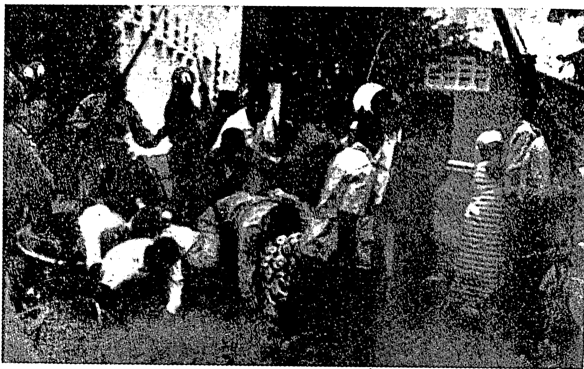
رعیة کوغکو سدغ دبلاسه دغن کچم اوله تنترا بونیکا فنجاجة دکوغکو.

جوقن. کاکل درفد فان سبواه جای جوک نکری دان غن. این ایاله غن نکارا ۲ ای سئورغ نکری عیم.