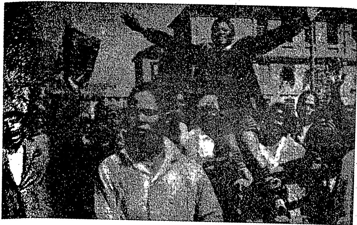
رعية كينيا سدغ ممفرواغن كمرديكان تانهايسر مريك دان منكنن كدولانن.

سلاين درفد ايت رواندا اوروندي اiale نكري يڅ رامى سكالى فندودقن، برجمله ليم جونا اورغ، مسكيفون نكرين كچيل دان سفية نسبة كهد فندودقن يڅ رامى ايت.