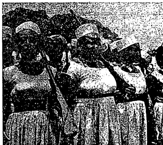
فاسوقن تنترا فرمفوان تنكاپيكا سدغ برباريس.

فد مولان كينيا دسيوا اوله برتن درفد سلطان زنزيار (زنجبار) دالم تاهون 1895 دغن 10 ريو فاون ستاهون. فيهيقيغبركواس برتيش