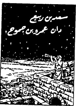
سینسخه 30 سین