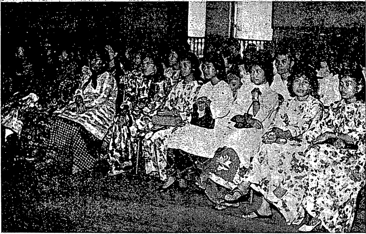
فلاجر ۳ تريڤس مالاو دري سيغافورا دان جوهر يفتله لولوس بهارو ۲ اين. دوا گمبر يث دتراکن دسيني تله دامبيل فد هاري فريسان سيجيل يفتله برانغسوغ دسکوله ريفلس سيغافورا.