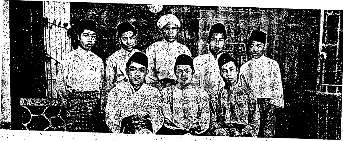
فلاجر ۲ السلام دری قدح «دارالامان» برکمیر انتوق کنانغن

تراوتام کفد فمودا ۲ن. نکارا کیت تانهلایو ایاله سبواه نکارا یغ مرسمیکن اسلام. منجادی اکمان دفرته اوله سلطان ۲ اسلام، چوکف دغن جاتن ۲ اکام. دان فراتورانن. تنافی فمودا ۲ن. سندیری بکوم جمودم تیدق منونیکن توکس ترهادف اکمان ۲ اکام اسلام. سبالیقن فمودا ۲ کریستیان تله مغمیل لککه ترفنتیغ مغمبشکن اجران اکام مریک. یغدمکین اداله مروفاکن ساتو چابران کفد فمودا ۲ اسلام دنکری این. حال این سیکیا لکس دسداری، دانصافی اوله فمودا ۲ اسلام. اف یغ سدغ برلاکو داندونیسینا جاغله هندقن دیبارکن برلاکو دسینی! سبب ایت سواجین فمودا ۲ اسلام مراس چمبورو ترهادف نصیب اکام اسلام فدماس دفن. الله تیدق اکن مغوبه نصیب سوات بقسام اکام دان نکارا سهشک بغسا ایت سندیرله یغ مغوبهن. دنکارا کیت سکارغ بندیشکنله دانتارا کریجا دغن مسجد. مان یغ له بایق ددیریکن دالم سبولن. بندیشکنله مان یغ بایق دانتارا اتق ۲ اسلام — سمبوغنن فد موک 36