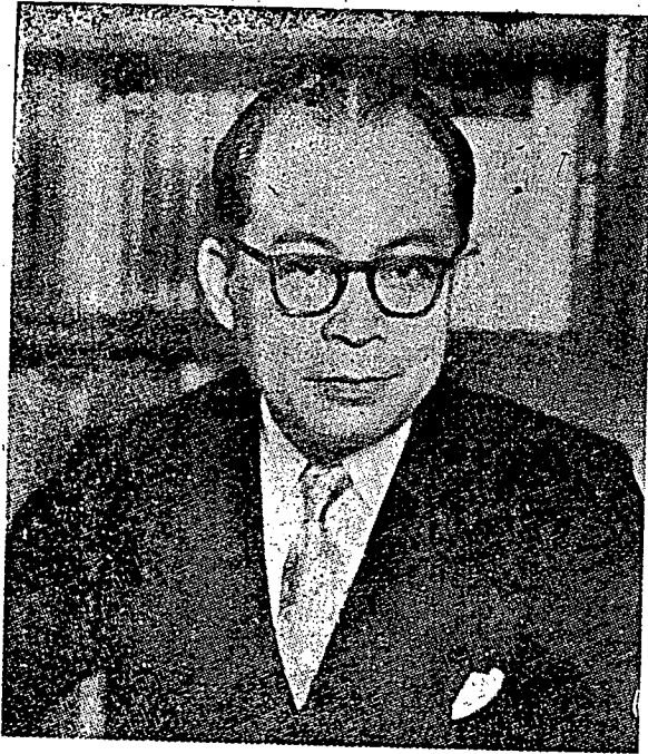
دكتور محمد حتى سكارغ دسيڤيركن سوكرنو. كالو دكتور حتى ممرته مورنكين رعية اندوييسيا تيدق مراس سدبن تيكوس كوريج.

دان راسن ميمغ اينق؛ تاجاوه دري كوريج اودخ. ددائر؛ چيجولغ دان سكيترن؛ يات دسلان فاريانغ تيمور؛ بلالغ دفرداكفن سباكي لاءوق فاوق انتوق ماكن ناسي.