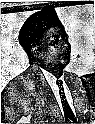
کیای محمد عیسی انصاري ساله سئورغ اغکوت مشومی یقتله دکوروغ اوله سوکرونو.

کرتوسویریو، سئورغ مجاهد اسلام اندونسیا، یغ سمنجق دري تاهون 1949 برجواغ انتوق منگکن نگارا اسلام داندونسیا تله دتیمبق ماني اوله سوکرونو افبیل سهاج اي دتکف دان دحکوم سباکي "فندرهاک اتو کرومبولن" یغ ملان سوکرونو. فرجواغن یغجالنکن اوله کرتوسویریو، بوکنن منجاري نام تنافي سباکي سوات جهاد انتوق منگکن نگارا اسلام (دارالاسلام) داندونسیا. اي مٹکة سنجات سلما 14 تاهون ملان ککواسان سوکرونو دغن سرب ککوراغن، کران اي مڤوباي کيقینن بهوا نگارا اسلام تیدق اکن دافة دتککن داندونسیا کالو تیدق دمندیکن دغن داره. اي چوکف مڤنل فریادي ۱ یغ دهدافین دان چوکف مڤنل سباکین درفد فیمفین ۲ اسلام داندونسیا سنديري یغ جادي منافق کران منجاک مصلحة ديري دان سوک ملبوتکن کيکین درفد لیدهن دسبکن سسوات کفرلوان انتوق فائده ديري مریک سنديري.