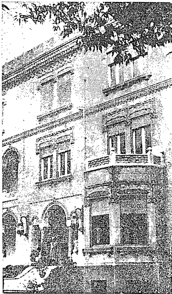
باغونن موءتمر اسلام دقاھرہ يغ منجادي فوسه فقهويغ اتارا اومه اسلام دسلوره دنيا.

(ص) اياله نبي اخر زمانم تيدق اد نبي دان رسول سلفسن ددالم منجواب سوالن ايت مك رسول الله برسبدا: "العلماء ورثة الانبياء". يعبرارتي "علماء اياله موارثي نبي ۲". مك تيدق شك لاكي بهوا عالم علماء له برتگوشجواب ددالم منجانکن کرج يقامة فتيخ اين. تنافي اين تيدقله ترخاص کفد عالم علماء سهاج انتوق منويکن توکس تبليغ اين بهکن کواچيفن