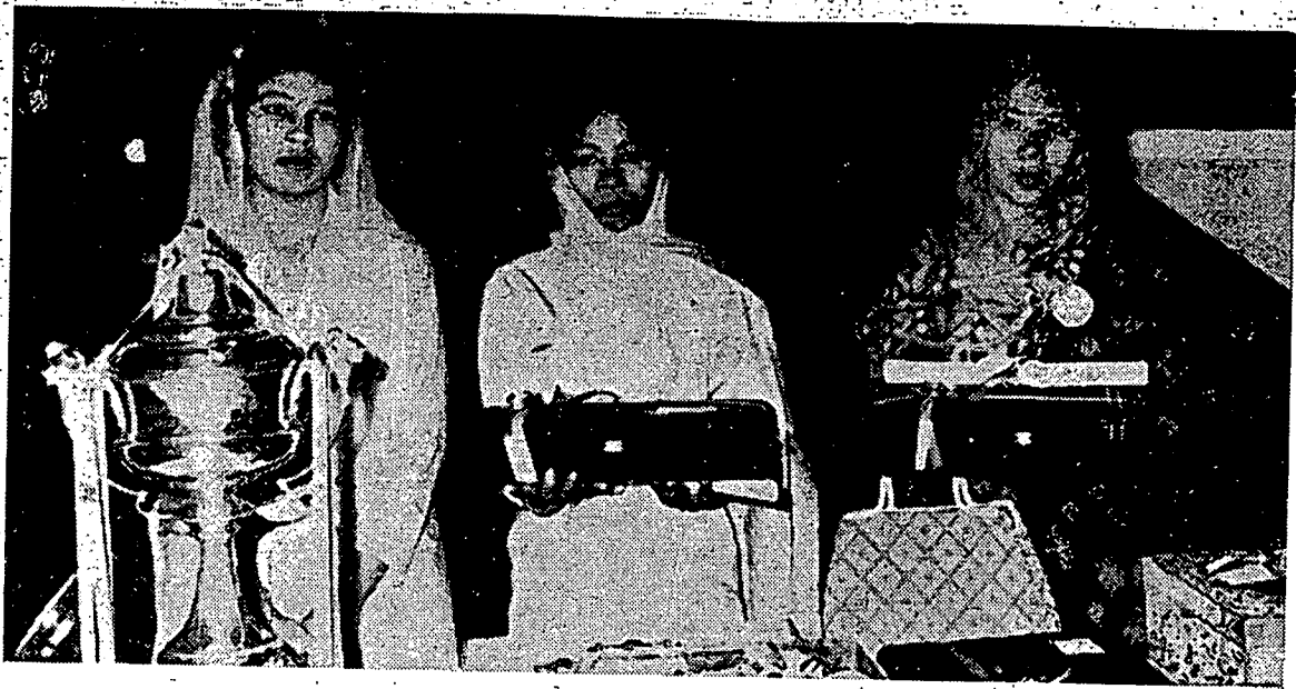
قارنه ۲ برکمبر ستله تمت فرادوان القرآن فریفته اننارا بقسا یغ تله دادکن دکوالا لمفور. سبله کیری ایاله چيء فریده بنت حاج محمد سمان قارنه دري کلتنن یغ تله مپندغ کلارن جوهرن کبشسان دان فریفته کبشسان تاهون این.

ارتین: "کالوله سسئورغ کامو مغمبیل تالین لالو منجاری کایو افي کمدین منجوالکنن، ایت اداله له بایک باکین درفد ممتنا ۲ کفد اورغ یغ اد کلان ماهو مبري اتو تا ماهو مبري"