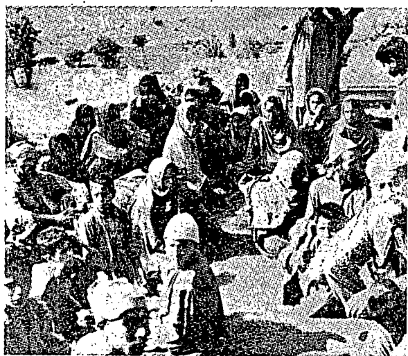
فرمفوان ۲ یغ ترفقسا کلوار درفد رومهتشان کران فقیومن تنترا ۲ اندیا دکشمیر.

سبب ۲ دان الاسن ۲ یغ سروف ایت اداله تیدق معقول. فرتمان بهوا تیگ بهوا کراجان یغ برکنان، اندونسیا، ملیسیا دان فاکستان ددالم فرکارا کونفرتناسی اداله تیگ بهوا نگارا اسلام جیغرافی. کدودقن فاکستان براختیار مندایمکن فرتلاکهن دانتارا ملیسیا دغن اندونسیا دان اختیار ۲ ایت سوده فون دجالنکن. اوله فاکستان تتافی سبکیمان اوسها لاین ۲ نگارا تیدق برجای.