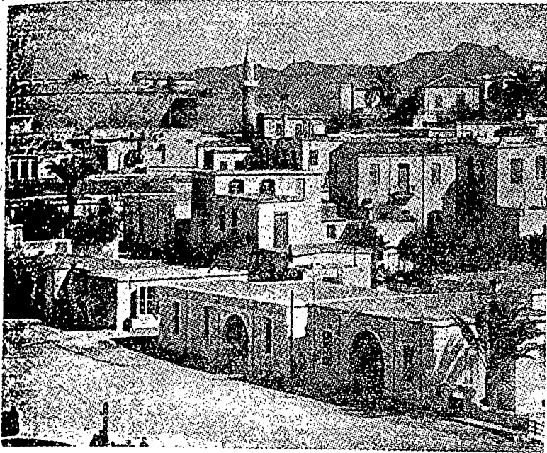
سوات فمنداغن دڪيرنيا، سيفرس.

اڪن مقبيل فول ڪواسن ۲ بوڪن سهاج داتس فولو ۲ تنافي ڪفد تانه بسر دتيمور دتفه.