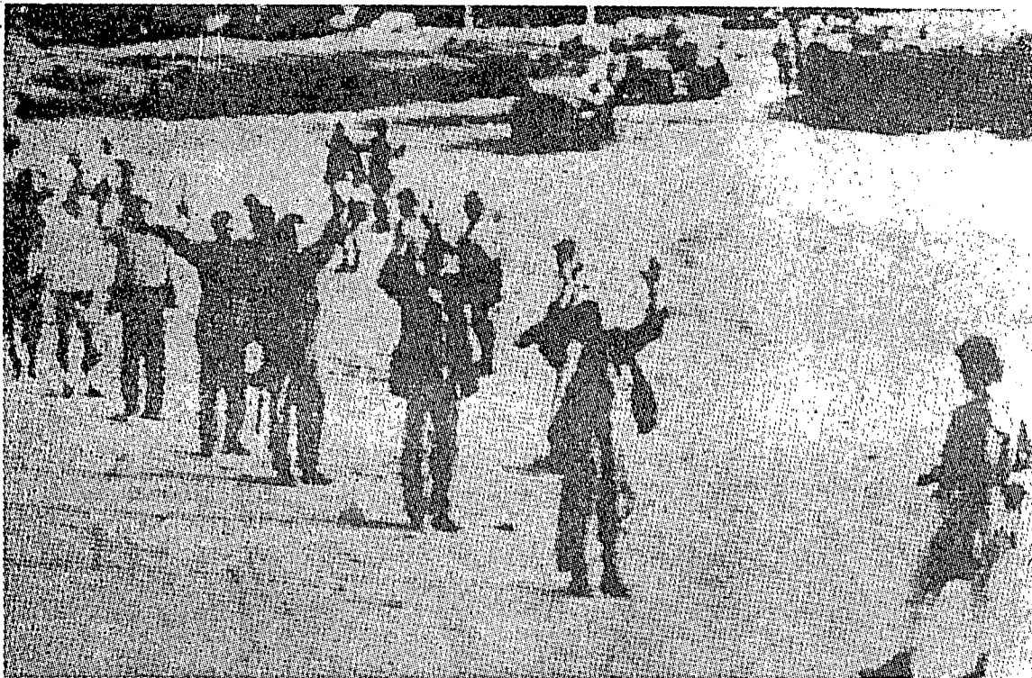
تنترا ۲۱ دارة اسرائيل دغن مثنكة تاغن مپره دبيري كغد تنترا ۲ مصر ددالم سوات فرتمفوران سفية دكاواسن سيناي. (كمبر دفتيق درفد الندوة).