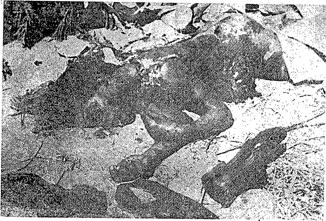
قوم وانيتا يغ لمة تا برداي جوگ تيدق ترلفس درفد منجادي قربان کگانسن تتترا ۲ اسرائيل يغ برصفة کاسر دان کجم ايت.