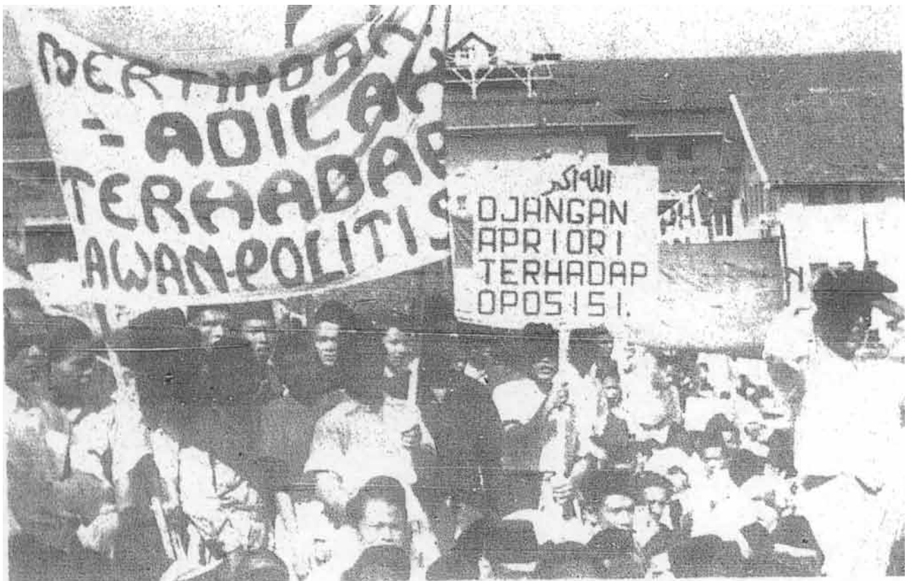
Cogan kata-cogan kata dibawa yang menunjukkan bahawa Masyumi sebagai puak pembangkang adalah kurang mendapat layanan.