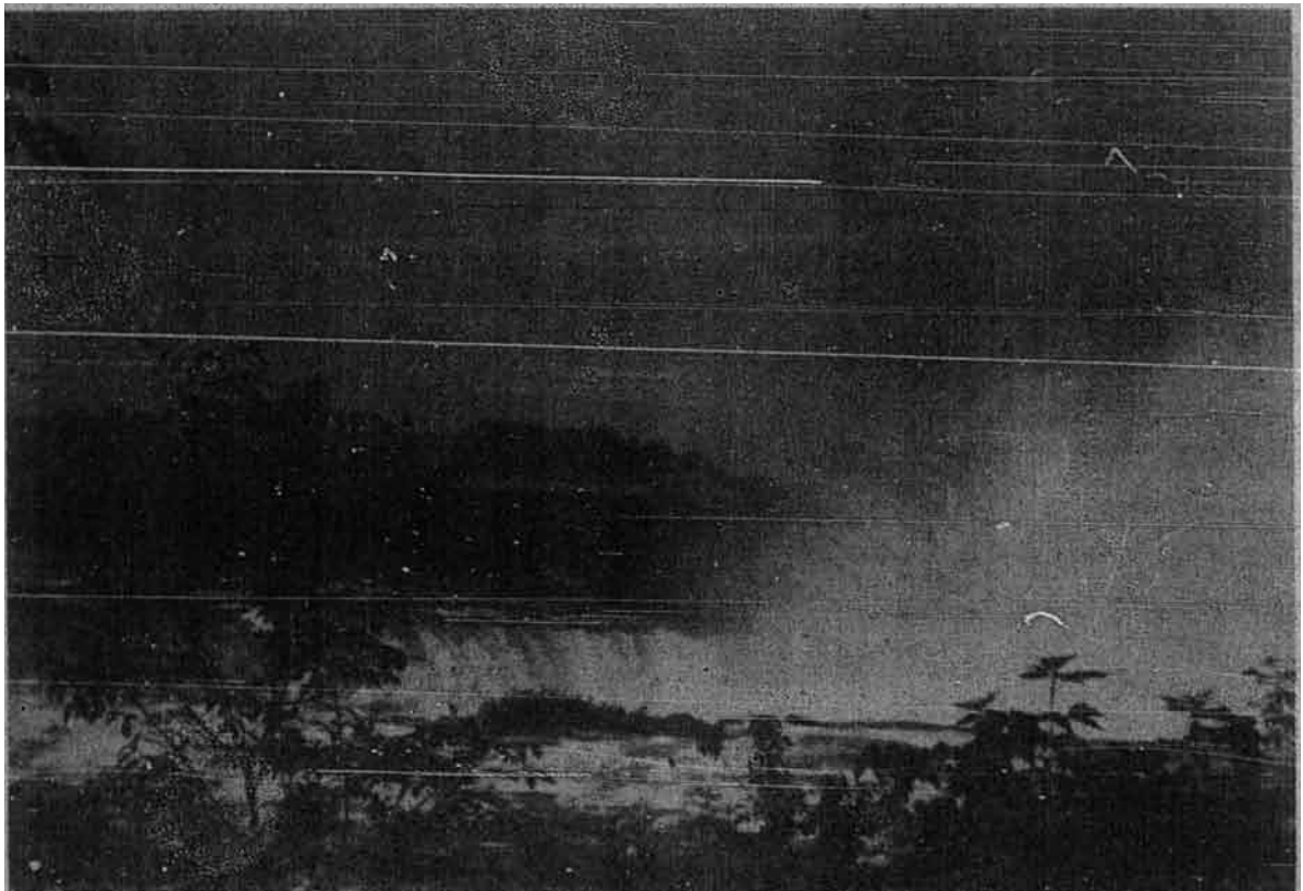
Air terjun Niagara dilihat dari tebing sebelah Amerika Syarikat. Di seberang ialah kawasan negeri Kanada. Sebahagian daripada air terjun ini di sebelah Amerika dan sebahagiannya di sebelah Kanada. Lihat wap air seperti kabus itu. (Gambar Ahmad Hussin)

berhajat hendak melihat air terjun yang sangat terkenal ini dan sekarang saya telah sampai ke tempatnya dan sebelum saya dapat melihat airnya bahana bunyi air terjun itu sudah pun sampai ke telinga seperti bunyi beberapa buah kapal terbang di langit. Waktu kami berjalan menuju air terjun itu saya lihat banyak kedai-kedai yang menjual barang-barang dan gambar-gambar berkenaan dengan Niagara. Nampaknya banyak orang boleh mencari makan di situ sebab adanya air terjun itu. Apabila kami sampai ke tebing air terjun itu saya lihat air yang banyak mengalir dengan derasnyanya meliputi satu kawasan yang luas seperti sebuah sungai besar dan air itu apabila sampai sahaja ke satu tempat dengan serta-merta terjun mencurah ke bawah menimpa batu dan air yang ada lebih seratus kaki di bawah dan tempat air terjun adalah diliputi oleh kabus dan tidak dapat dilihat dengan terang. Air terjun Niagara itu mencurah-curah datangnya dan dengan deras dan nampaknya siapa yang jatuh