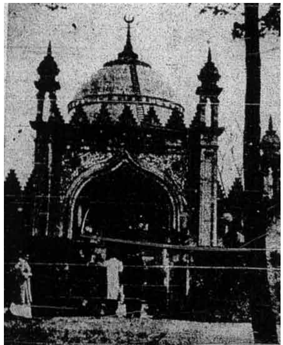
Masjid “Shah Jehan” sebuah Bangunan Islam yang tertua di England .