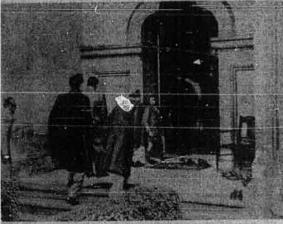
Setengah daripada penduduk Islam di London sedang berjalan