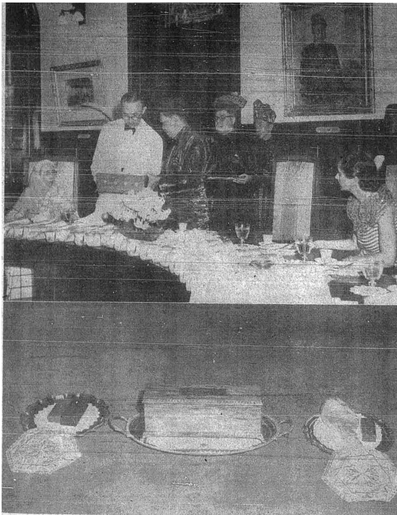
Dalam majlis makan malam di Istana Kuala Lumpur, Sultan Selangor bagi pihak Sultan-sultan Melayu telah menyampaikan “tanda mata” raja-raja Melayu kepada Jeneral Templer Templar dan Lydia Templar yang berpisah dari Malaya pada akhir bulan Mei yang lalu.