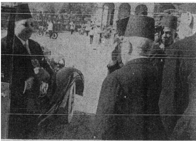
Al-Malik Farouk tiba di bangunan Parlimen Mesir