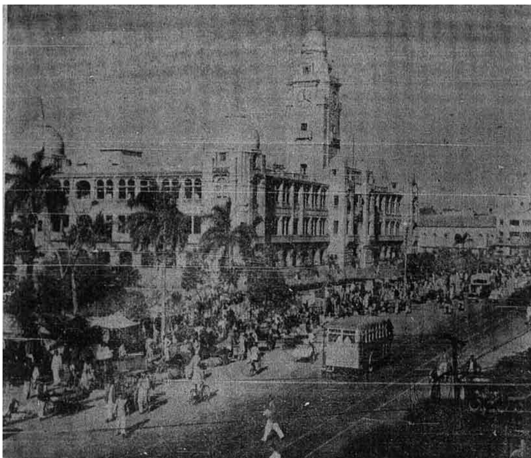
Suatu pemandangan yang indah di bandar Karachi ibu negeri Pakistan.

Atas asas inilah terdiri falsafah al-Imam Fakhr al-Dīn al-Razi dalam mentafsirkan kalam Allah, apatah lagi telah dibukakan Allah Ta‘ālā hatinya, dan dimudahkan gerak usahanya.