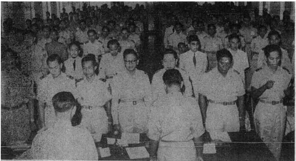
Bakal-bakal pahlawan tanahair Indonesia sedang mengucapkan sumpahnya sesudah tamat pengajian mereka di sekolah tentera.