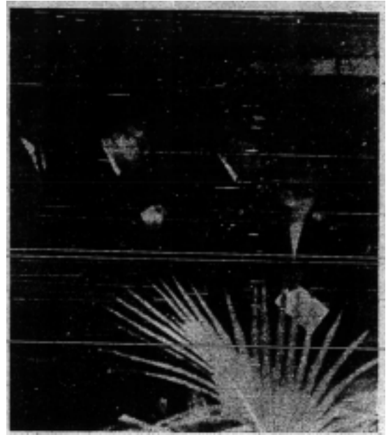
Wakil Indonesia dalam Kolokium yang telah diadakan di Lahore, Karachi baru-baru ini.