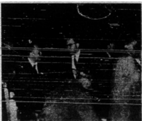
Pemandangan dalam Kolokium di Lahore, Karachi