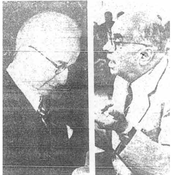
Kanan : Celâl Bayar Yang di-Pertua Negara Turki yang berjiwa Islam.

Apabila azan itu telah dibolehkan di negara nyatalah membuangnya maka seseorang guru dari sekolah tinggi di Ankara dengan kerana tidak berpuashatinya telah mendatangkan dakwa