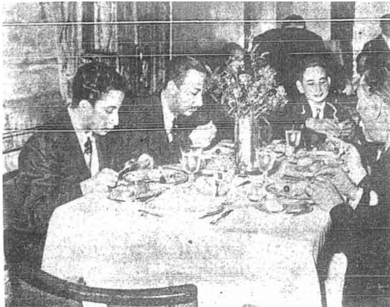
Al-Malik Faisal (Iraq) sedang mengadap meja santapan dalam masa persinggahannya di Iskandariah

dari menjadikan kalimah-kalimah itu perhiasan di kedainya. Perhentian-perhentian