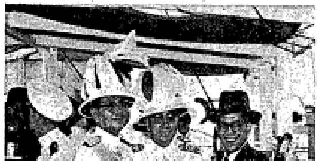
Tunku Abdul Rahman (kiri) Datuk Abdul Razak bin Hussein (tengah) dan Tuan Lim Yew Hock dalam masa istiadat penyerahan Angkatan Laut Singapura kepada Persekutuan Tanah Melayu.

Kita beriman bahawa pada hari akhirat akan adanya timbangan (neraca) amalan dan kita tetapkan bahawa amalan-amalan itu ditimbang dengan timbangan yang layak dengan alam akhirat. Dengan dialah ditimbang iman, akhlak dan amal. Jangan kita membahaskan rupa dan kelipatnya dan tentang daun neraca. - ( Tafsir al-Manār 8: 325).