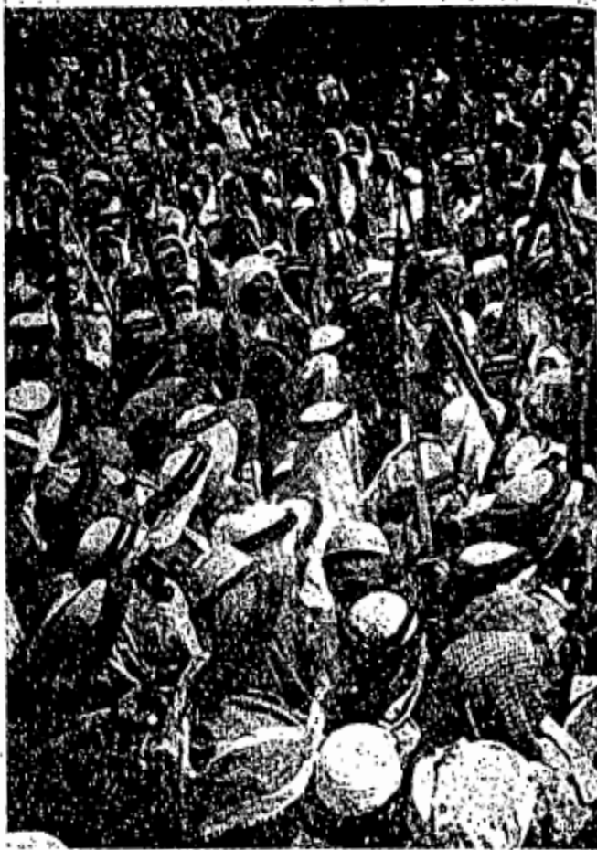
Sebahagian dari tentera Islam, pengawal negara Saudi Arabiyah, sedang berhimpun dalam suatu perayaan.

terlalu dianiayakan) berkata: Ya Tuhan kami! Keluarkanlah kami dari dalam negeri ini yang zalim penduduknya dan jadikanlah untuk kami seorang pemimpin (yang akan memimpin kami) dan seorang pembela (yang akan membela nasib kami.)” (57, al-Nisā ’).