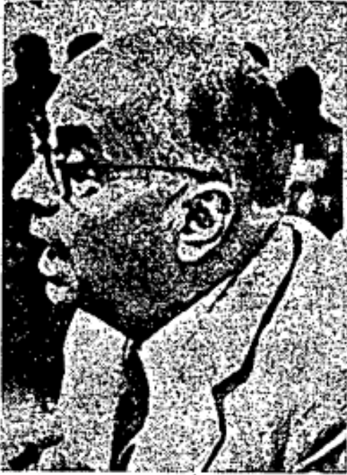
Jalal Bayar – Bekas Presiden Turki

sambil berternak. Jumlah mereka semuanya ditaksir adalah kira-kira 60 juta jiwa.