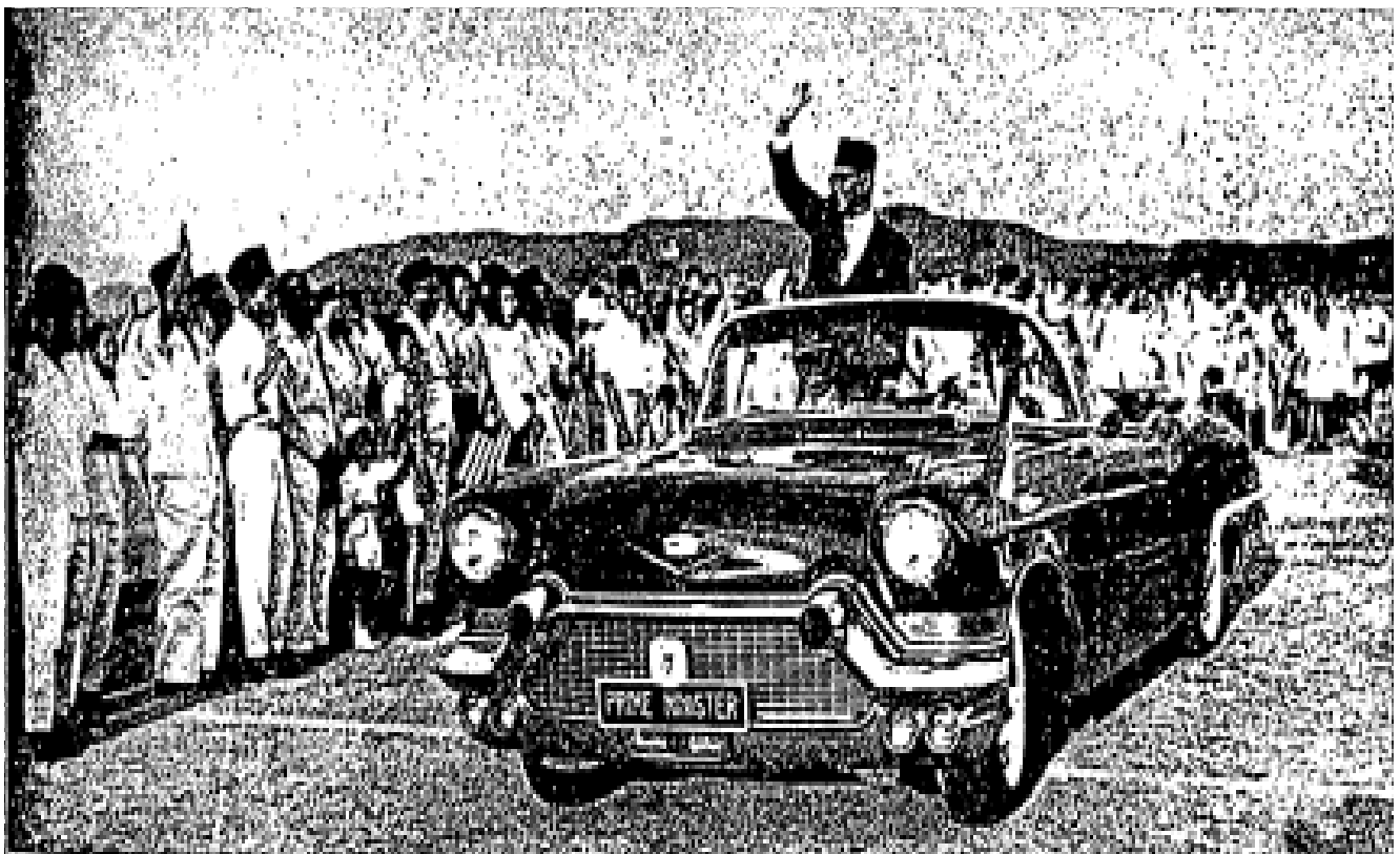
Rakyat Persekutuan Tanah Melayu dari segala lapisan sedang mengalu-alukan ketibaan Tengku Abdul Rahman dari London pada bulan yang lalu. Tengku telah berjaya menyampaikan suara rakyat Persekutuan yang mengutuk dasar perbezaan warna kulit Afrika Selatan – dalam persidangan Commonwealth di London.

dapat mengemudikan haluannya dengan cukup teratur dalilnya sudah terang sekarang ini, dasar Komunis itu adalah rekaan akal manusia, selama ini orang bijak pandai, ahli-ahli fikir tak dapat mempertahankan serangannya. Bermacam-macam tipu muslihat hendak mengalahkannya segala-gala usaha mereka gagal, hanya satu sahaja cara yang dapat menahankan dari serangannya yang mengancam itu, iaitulah selagi Islam itu masih berakar umbi di jiwa tiap-tiap pemeluknya, maka selama itu ajaran komunisme tak dapat mematahkannya dan tak dapat melawannya, dan tak dapat menjalankan kekuasaannya kepada orang yang mempunyai roh keimanan dan kesedaran luas di dalam Islam ertinya