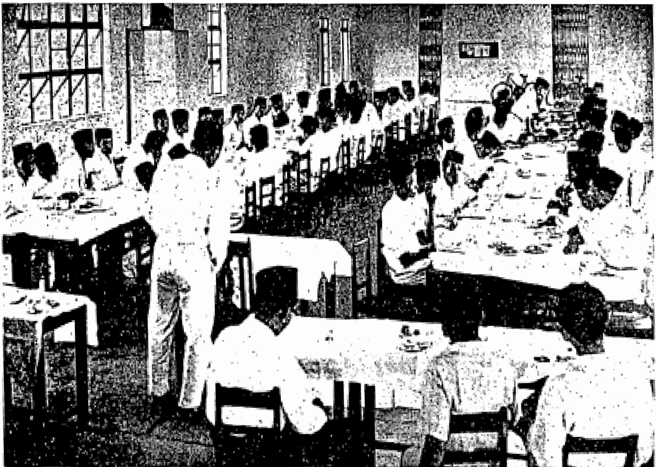
Suatu pemandangan dalam majlis jamuan ringan anjuran guru-guru dan pelajar-pelajar agama Maktab Perguruan Islam pada hari penerimaan hadiah kelulusan dari maktab tersebut, yang dilangsungkan di Maahad Muhammadi, Kelantan baharu-baharu ini. Yang berdiri ialah ketua pelajar sedang memberi ucapan terima kasih.

kita sendiri. Sebab itu bila ditanya kepada Menteri-menteri yang memegang teraju pemerintahan Tanah Melayu hari ini tentang soal rupa bangsa, mereka menjawab dengan tidak secara tegas, hanya cuba juga berselindung dan hendak mengelirukan. Hal ini menunjukkan bahawa kerajaan kita hari ini adalah lemah di dalam memperjuangkan hak bangsanya sendiri. Kenapakah saya katakan begitu, ialah kerana boleh dikatakan kabinet hari ini adalah dipegang oleh orang-orang kita Melayu, ertinya di tangan kitalah kekuasaan yang kuat dan penuh, kenapa pula kita takut dan ragu-ragu di dalam memberi hak keistimewaan kepada