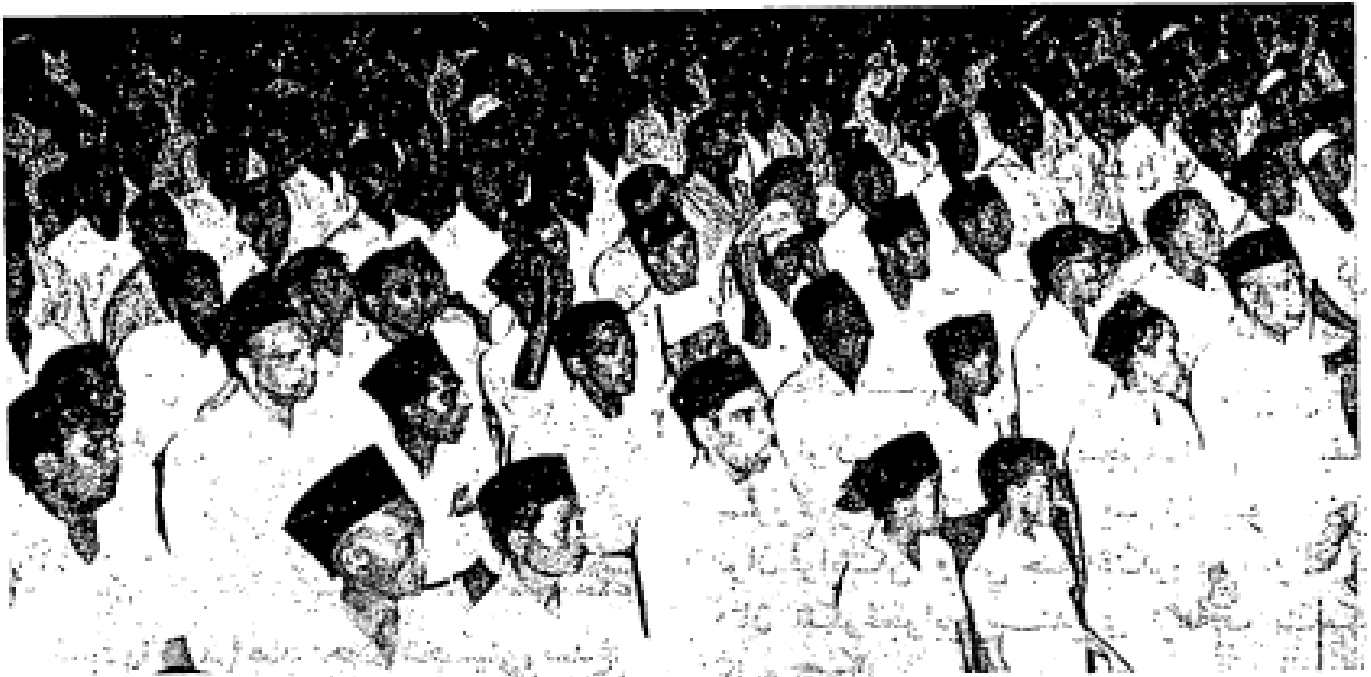
Sidang hadirin pada malam yang berbahagia itu sedang mendengar riwayat hidup dan jasa-jasa Rasulullah ṣallā Allāh ‘alayhi wa sallam dalam masyarakat dunia umumnya.

Ertinya: “Muhammad itu Rasul (Pesuruh) Allah dan orang-orang yang beserta (dengannya) keras (tegas) terhadap orang-orang kafir, (dan) berkasih sayang di antara mereka sesama mereka (sesama Muslimin) engkau lihat