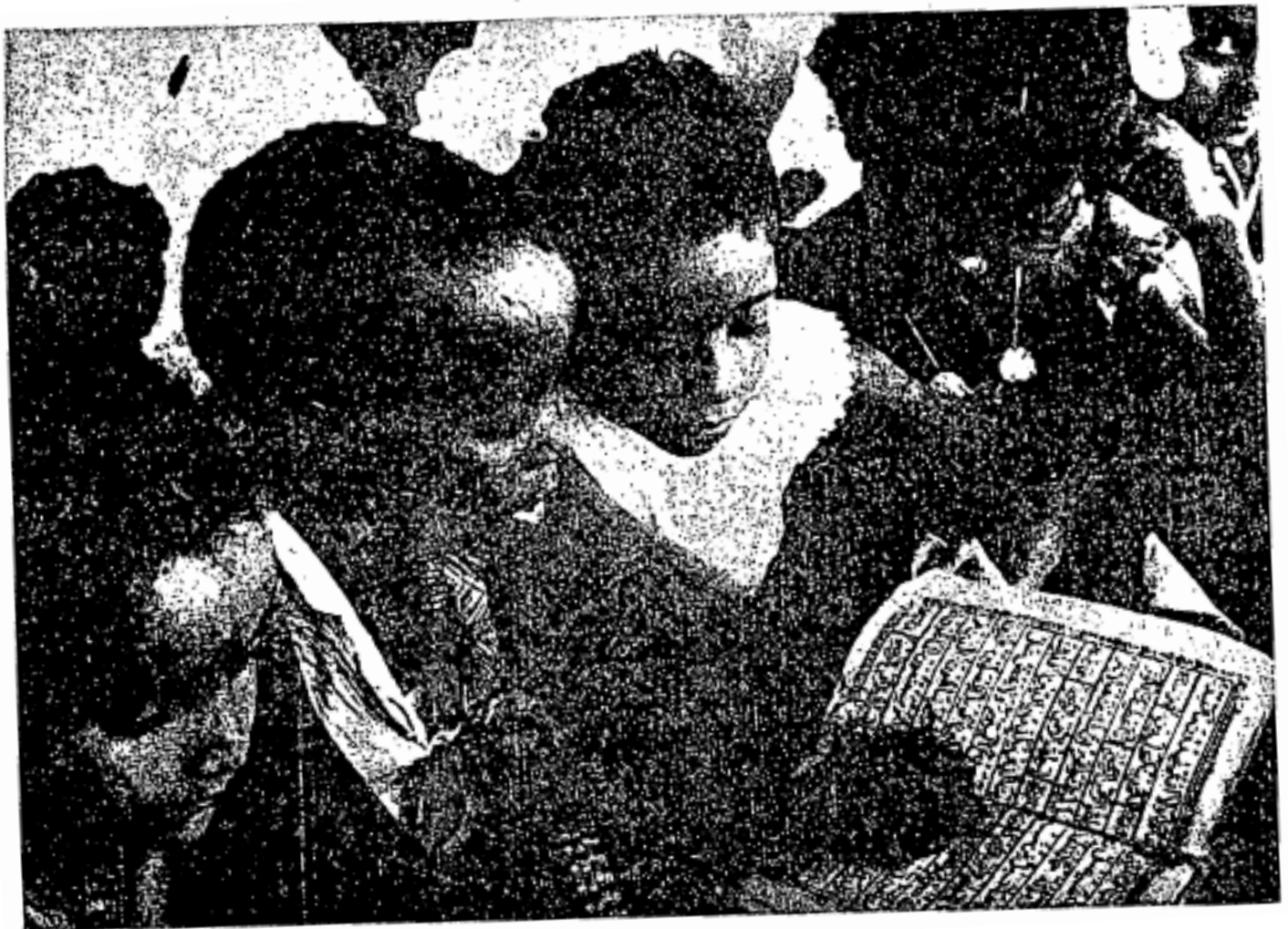
Kanak-kanak Islam Afrika sedang mengaji Qur'an dengan rajinnya. Tempat mengaji Qur'an ini ialah di bandar Usumbura, ibu negeri Ruanda-Urundi.

Mereka tidak berhenti daripada bertakbir melainkan