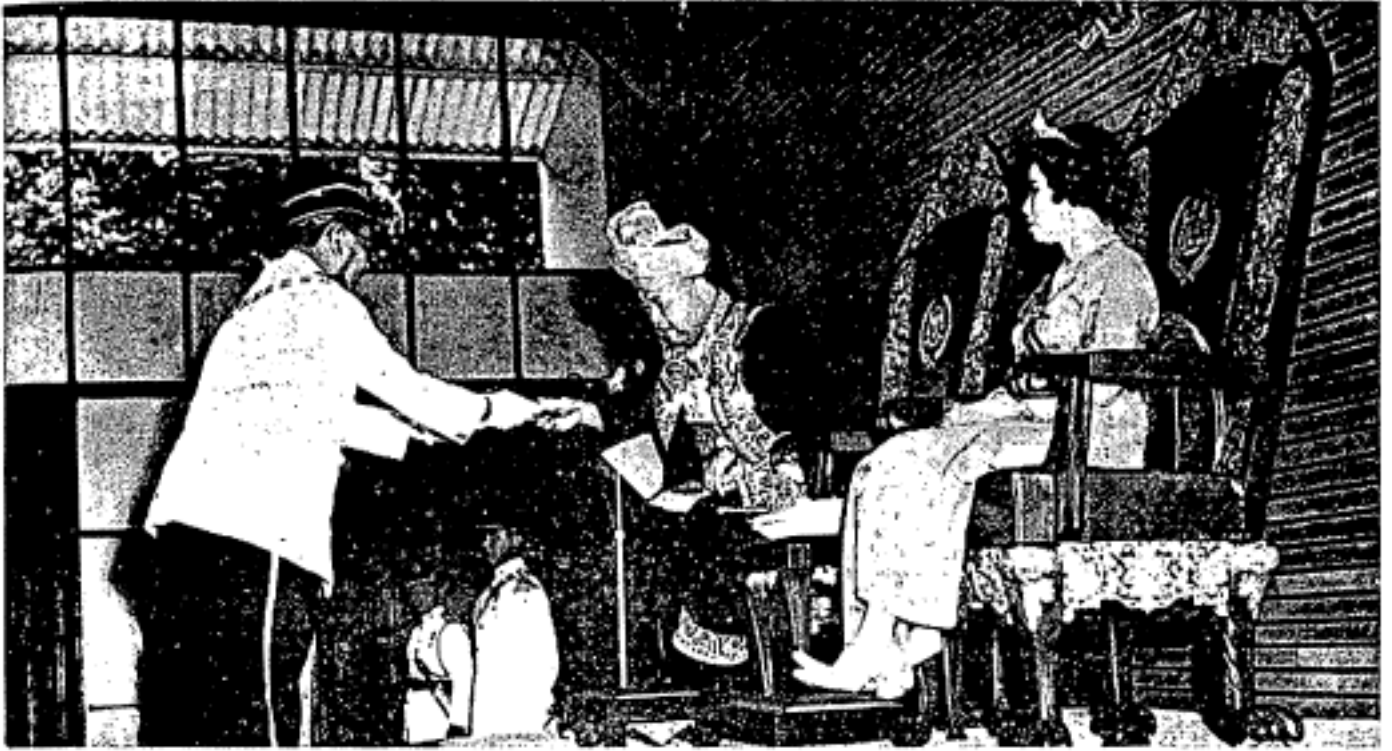
Suatu pemandangan ketika Duli Yang Maha Mulia Seri Paduka Baginda Yang di-Pertuan Agong sedang membuka Parlimen

baharu-baharu ini. Gambar menunjukkan Perdana Menteri Tengku Abdul Rahman Putra al-Haj sedang mempersembahkan naskah