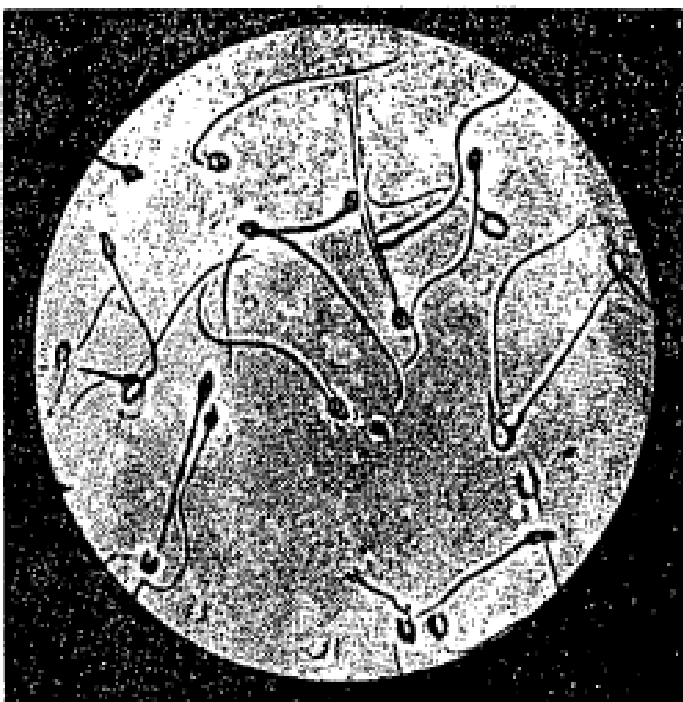
Gambar menunjukkan "benih lelaki" setelah dibesarkan gambarnya beribu-ribu kali ganda.