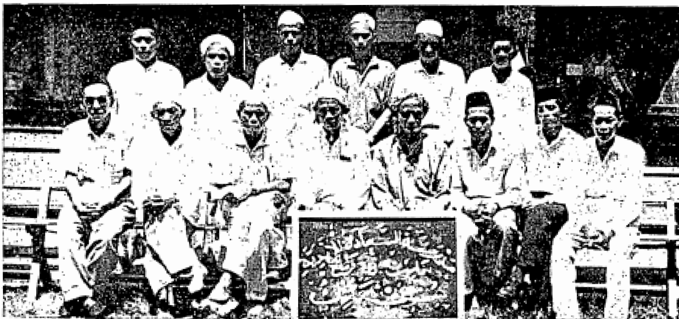
Ahli-ahli jawatankuasa madrasah as-Sa'adah al-Abadiyyah, Parit 7B, Permatang, Sungai Manik, Teluk

melihatnya lalu memerintahkan tempat jualan itu hendaklah ditutup