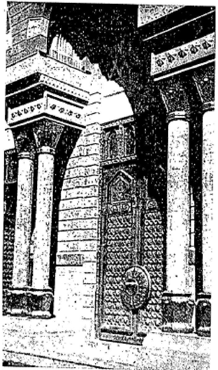
Suatu pemandangan dalam masjid junjungan kita

Nabi Muḥammad ṣallā Allāhu ‘alayhi wa sallam di Madīnah al-Munawwarah.